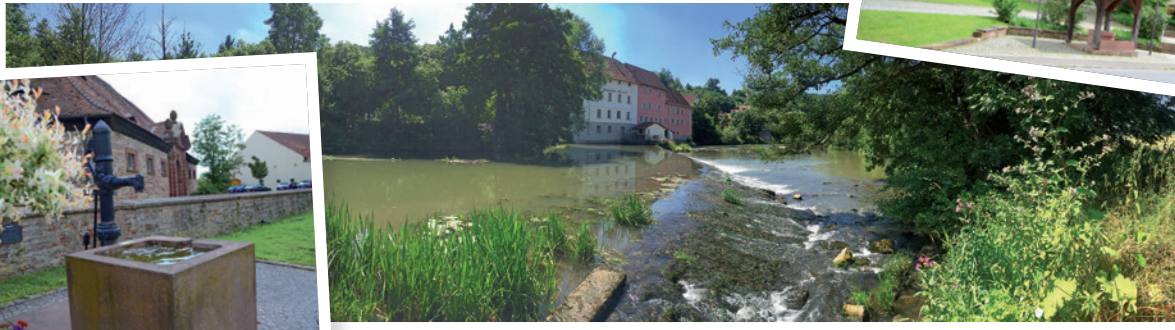
Das Saale-Wehr in Trimberg