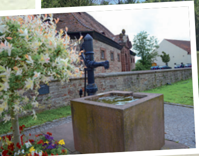
Brunnen vor dem Schloß Elfershausen

Unsere Marktgemeinde, bestehend aus den Gemeindeteilen Elfershausen, Trimberg, Engenthal, Machtilshausen und Langendorf , bietet Ihnen vielfältige Möglichkeiten der Freizeitgestaltung. Erholung Suchende, Aktiv-Wanderer sowie sportlich oder kulturell interessierte Besucher finden abwechslungsreiche Natur und seltenes kulturelles Erbe, wie z.B. die Trimburg, mitten in Deutschland. Ideal für Ihren Kurzurlaub oder Tagesausflug.