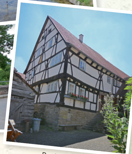
Das historische „Schreinersch- Haus“ in Machtilshausen